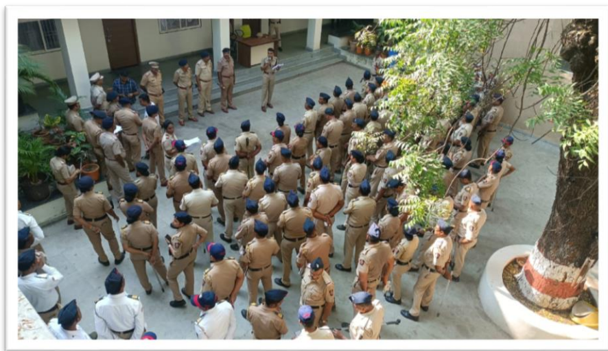
पोलीस माहिती कक्ष नागपूर जिल्हा (ग्रामीण), नागपूर